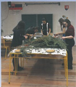
Príprava výrobkov a účasť na trhoch