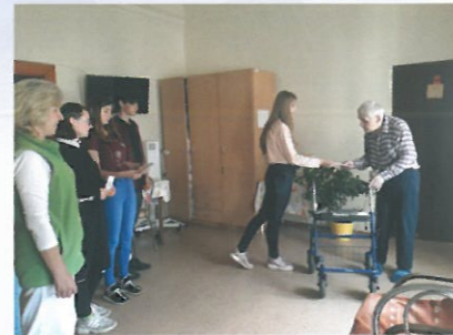
Práca s verejnosťou