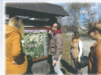
Spolupráca s miestnymi oblasťnými organizáciami cestovného ruchu a s obecnými úradmi