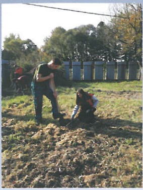
Sadenie a starostlivosť o ovocné stromy, vinič