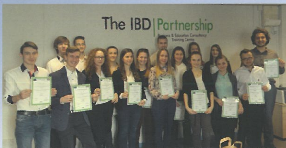
Stáže v zahraničí