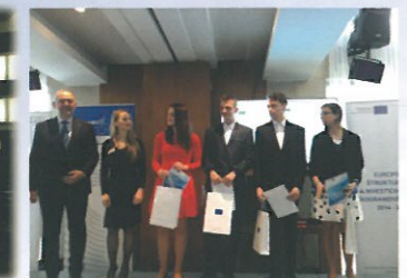
Účasť na výstavách, veľtrhoch, súťažiach a exkurziách