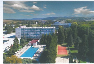
Spolupráca s Kúpele Dudince a. s.